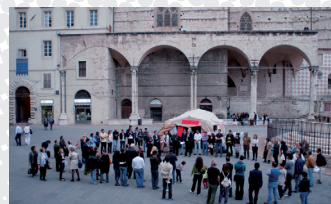
La scorsa edizione di Piazze di Maggio a Perugia.