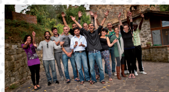
Alcuni dei studenti di Rondine.

Il tema del "Le Piazze di Maggio 2012" sarà "comunicare attraverso la musica, l'arte e la festa". L'obiettivo sarà quello di mostrare l'universalità del linguaggio della musica, che apre all'altro ed educa all'armonia, e evidenziare come la musica, attraverso la festa, ci rende liberi di esprimere le nostre emozioni, i nostri sentimenti, e ci fa scoprire le nostre diversità e le nostre ricchezze.