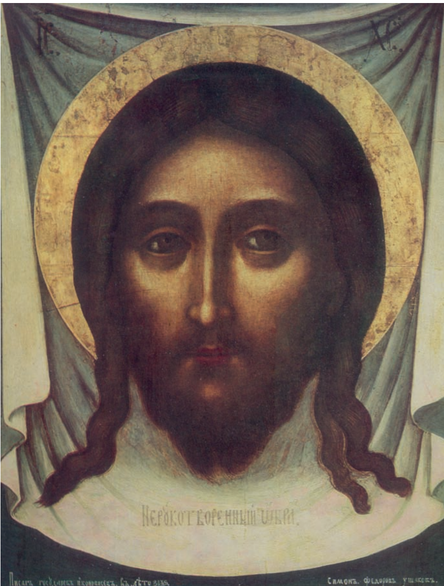
Il volto di Gesù nel panno di lino della Veronica (icona russa di Simon Ushakov, The Tretyakov Gallery, Mosca)