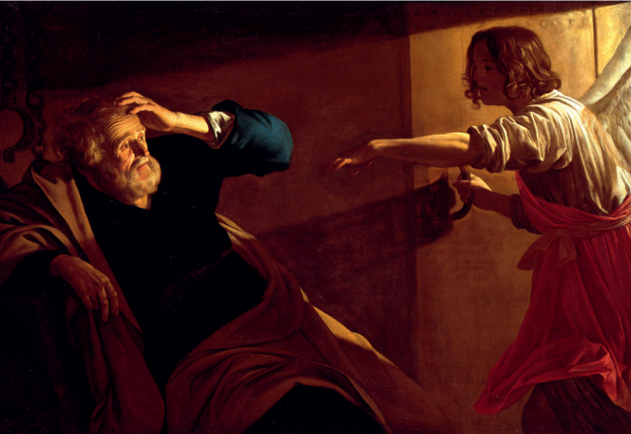
Gerrit van Honthorst (da), L'angelo libera Pietro dal carcere , olio su tela, 1630 circa, Prato, Museo Civico