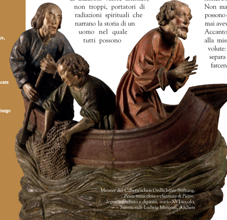
Meister der Cabern'schen Gedächtnis-Stiftung, Pesca miracolosa e chiamata di Pietro , legno intagliato e dipinto, inizio XVI secolo, Suermondt-Ludwig Museum, Aachen

di indubbio valore artistico, non troppi, portatori di radiazioni spirituali che narrano la storia di un uomo nel quale tutti possono